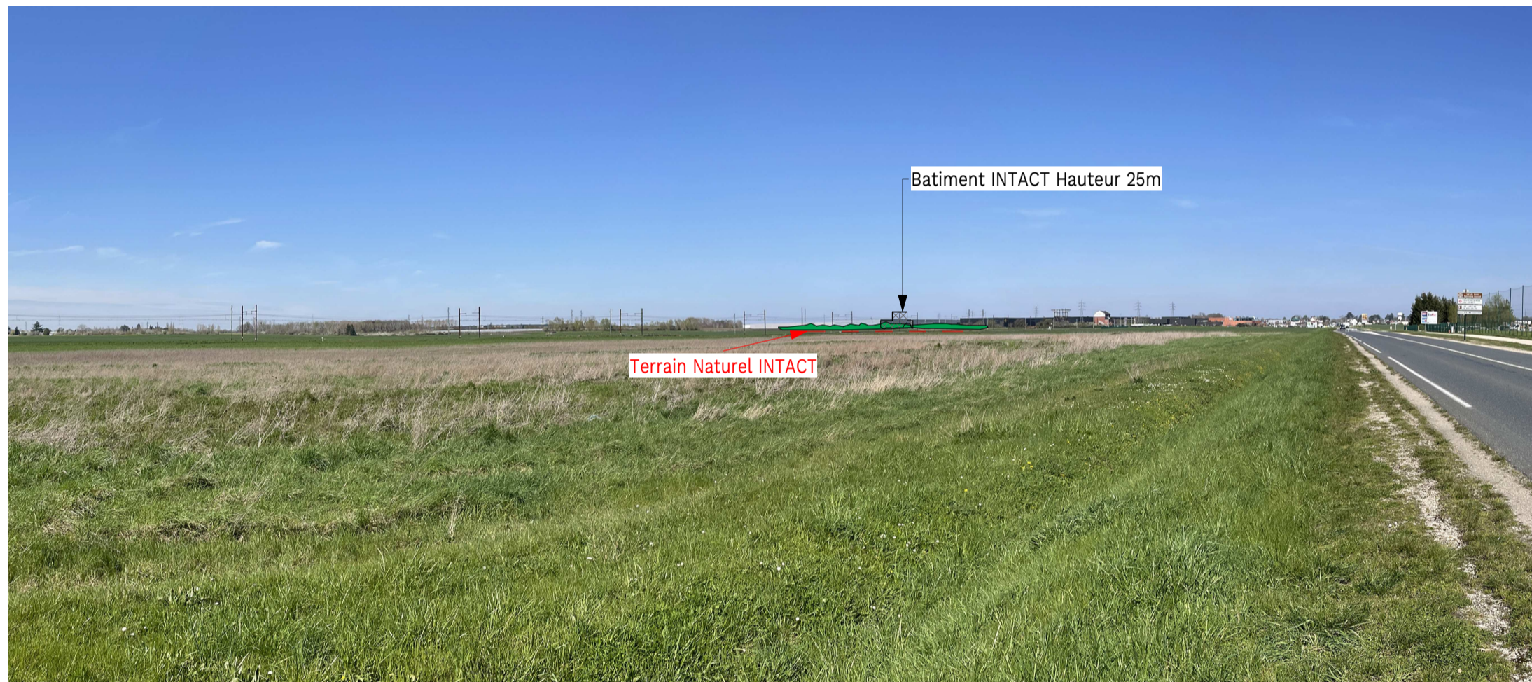
2 VUE SORTIE BOURG BAULE 1 : 100