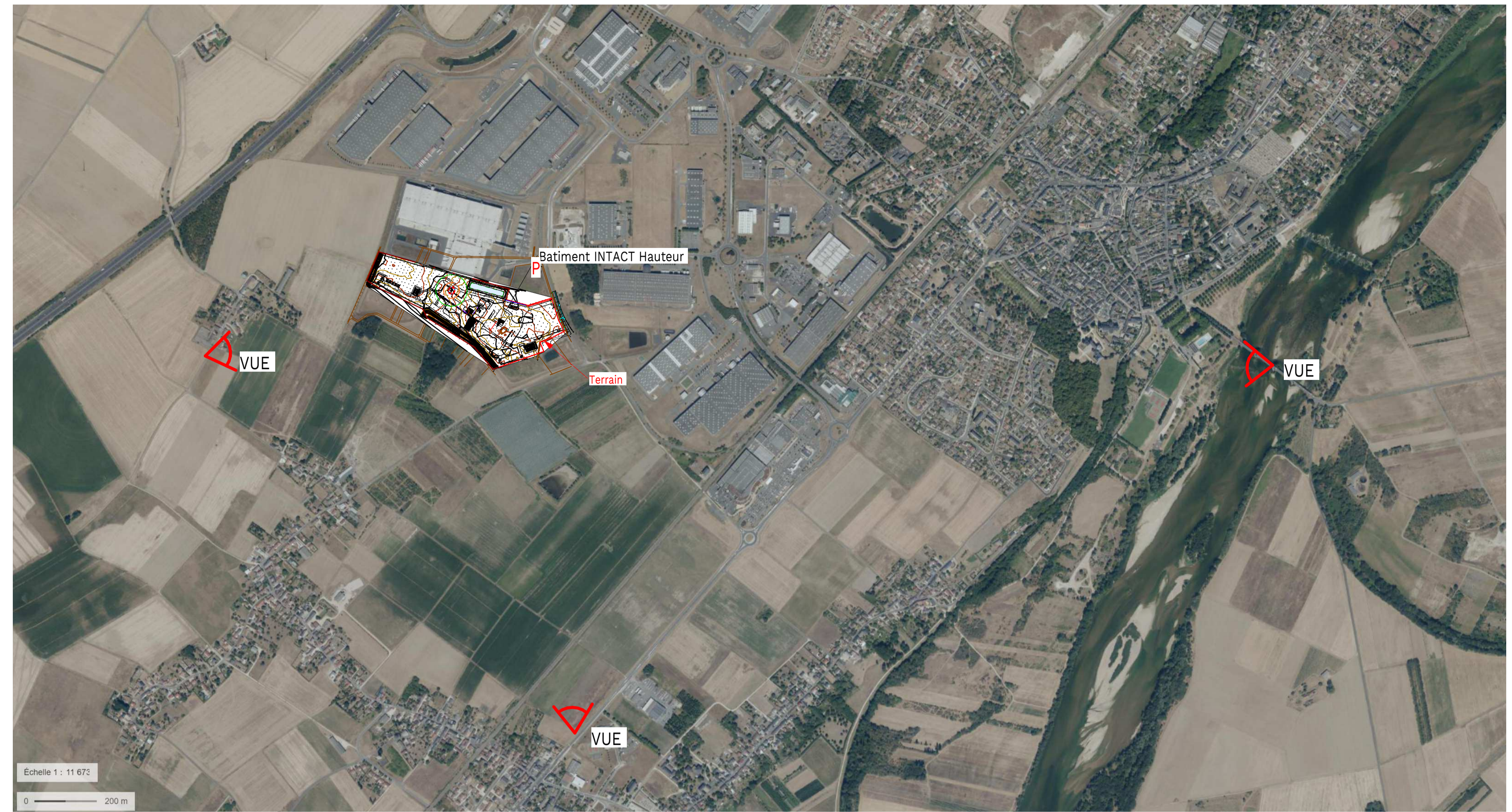
0 PC-VUE AERIENNE . 1 : 10000